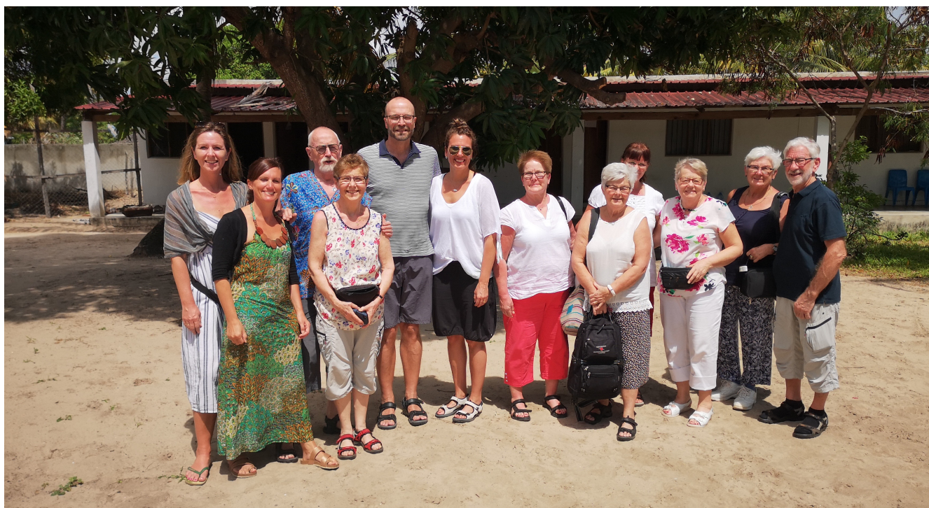
Hela gruppen av resenärer från EFK-församlingar i Vilankulos