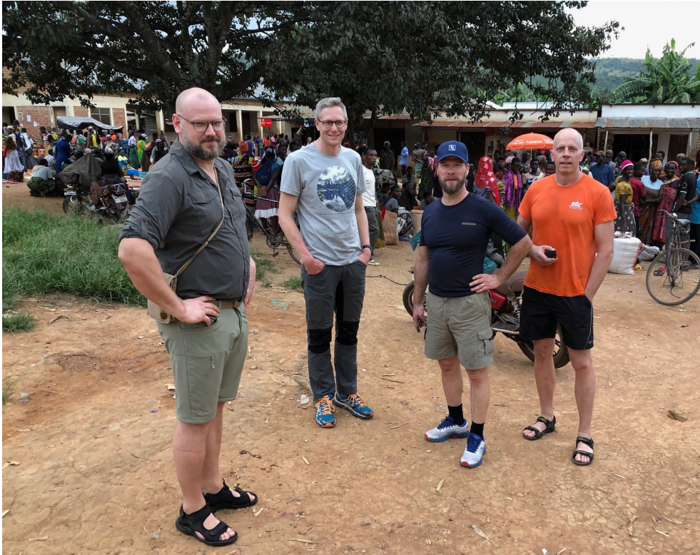
På kvällspromenad i centrum av Kabare-byn en av kvällarna.

Tack för att ni finns med och stöttar oss och arbetet i region Afrika. I en utmanande tid i hela världen behöver vi varandra mer än nånsin. Även om vi inte kan göra arbetsresor just nu håller vi tät kontakt med våra vänner och ger stöd på det sätt vi kan. Vi anar att detta år blir extra tufft för många, desto viktigare att EFK kan fortsätta med sina projekt och insatser. Var med och fortsätt be och ge!