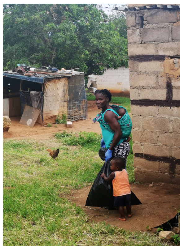
En mamma med barn i Gwaini

Att få ha med flera av er som finns med och stöttar oss och arbetet i Afrika när jag besökte partners var väldigt givande och roligt. Något som blev starkt för oss alla, både vi i svenskgruppen och våra partners, var hur tydligt det är att vi tillhör samma kropp, Kristi kropp! Det är fantastiskt att få möta syskon i olika länder, och det var en stor uppmuntran även för våra partnerkyrkor.